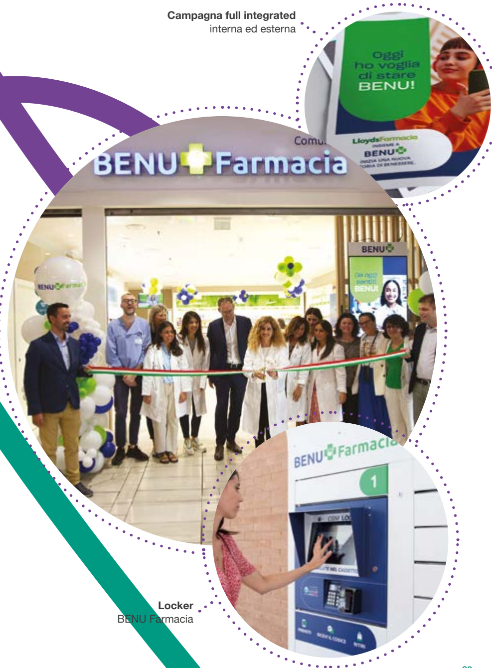
Locker BENU Farmacia

Campagna full integrated interna ed esterna