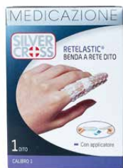
1 Benda a rete Dito calibro 1 €€