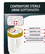
Contenitore per urine sottovuoto 120 ml €€