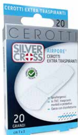
20 Cerotti Grandi cm 7 x 3 €€ 0373