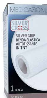
1 Benda €€ cm 10 x m 4