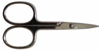
Forbici unghie punta curva