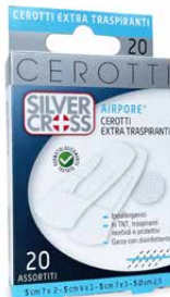
20 Cerotti Assortiti cm 7 x 2 - cm 4 x 1 cm 7 x 3 - Ø cm 2,5 €€ 0373