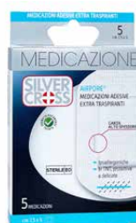
5 Medicazioni Adesive €€ cm 7,5 x 5 0373