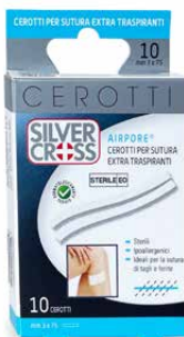
10 Cerotti Sutura cm 3 x mm 75 €€ 0051