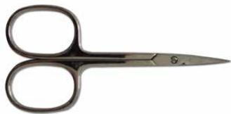
Forbici pelle punta curva