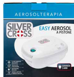
Easy Aerosol Aerosol a pistone