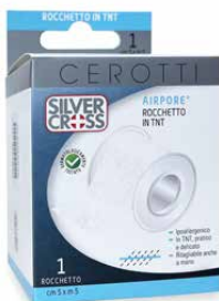
1 Rocchetto cm 5 x m 5 €€