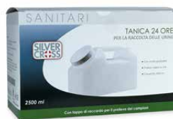
Contenitore urina 24H 2500 ml €€