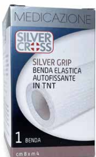
1 Benda €€ cm 8 x m 4