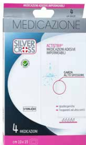
4 Medicazioni Adesive €€ cm 10 x 15 0373