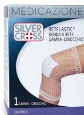
1 Benda a rete Gamba Ginocchio calibro 5 €€