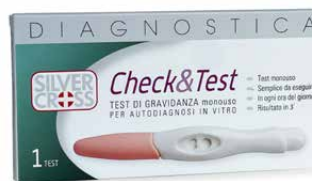
Test di gravidanza 1 test