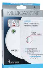
4 Medicazioni Adesive €€ cm 10 x 15 0373