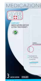
3 Medicazioni Adesive €€ cm 10 x 25 0373