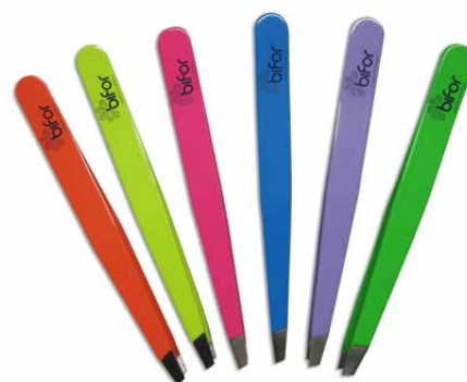
Pinzetta inox punta obliqua colori assortiti