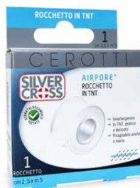
1 Rocchetto cm 2,5 x m 5 €€