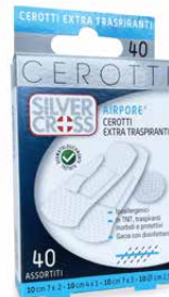
40 Cerotti Assortiti cm 7 x 2 - cm 4 x 1 cm 7 x 3 - Ø cm 2,5 €€ 0373