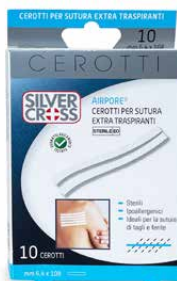
10 Cerotti Sutura cm 6,4 x mm 108 €€ 0051