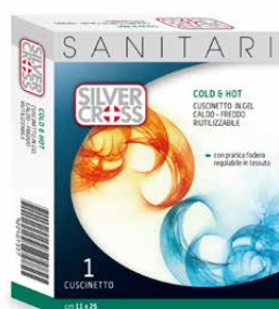
Cuscinetto in gel €€ 1 cuscinetto riutilizzabile caldo - freddo 0546