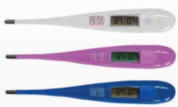
Digital Classic Termometro a punta rigida