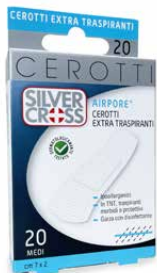
20 Cerotti Medi cm 7 x 2 €€ 0373