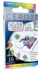
16 Cerotti Assortiti effetto tattoo cm 6 x 2 - cm 7 x 3,8 €€ 0373