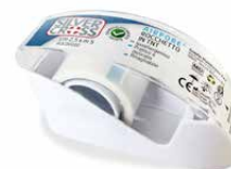
1 Dispenser Rocchetto cm 2,5 x m 5 €€