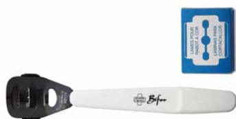
Rasoio callosità + 10 lame