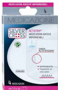
4 Medicazioni Adesive €€ cm 7,5 x 10 0373