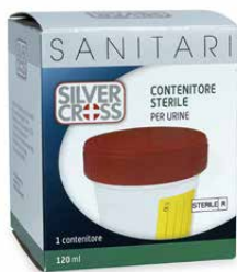
Contenitore sterile per urine 120 ml €€