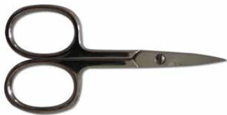
Forbici unghie punta dritta

Una linea di prodotti completa e specifica per la cura di mani e piedi