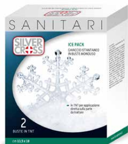
Ghiaccio istantaneo €€ 2 buste monouso 0546