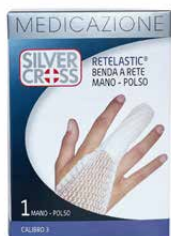
1 Benda a rete Mano - Polso calibro 3 €€