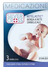
3 Bende a rete Ombelicali con Garze Sterili di puro Cotone €€