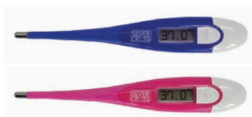
Digital Flex Termometro a punta flessibile