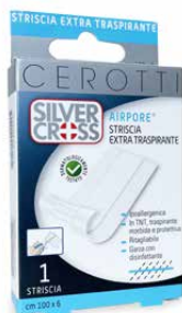
1 Striscia cm 100 x 6 €€ 0373