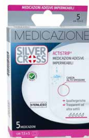
5 Medicazioni Adesive €€ cm 7,5 x 5 0373