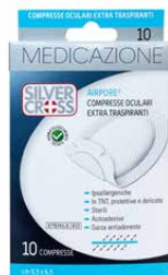
10 Compresse Oculari €€ cm 9,5 x 6,5 0051