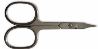
Forbici unghie punta lancia