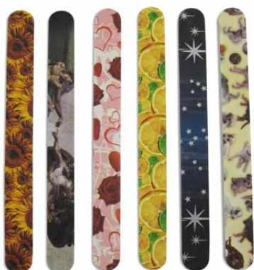
Lima smerigliata cm 17,5 fantasie assortite