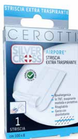
1 Striscia cm 100 x 8 €€ 0373