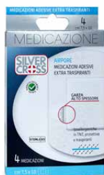
4 Medicazioni Adesive €€ cm 7,5 x 10 0373