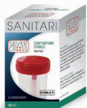
Contenitore sterile per feci 60 ml €€