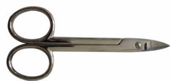
Forbici unghie piedi