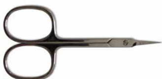
Forbici pelle punta lancia