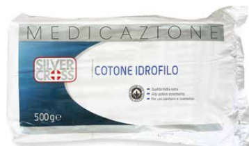
Cotone g 500 €€