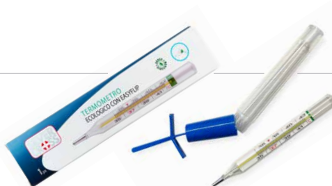
Termometro Ecologico con easy flip Termometro clinico per la misurazione della temperatura corporea, ecologico, a galinstano, senza mercurio.